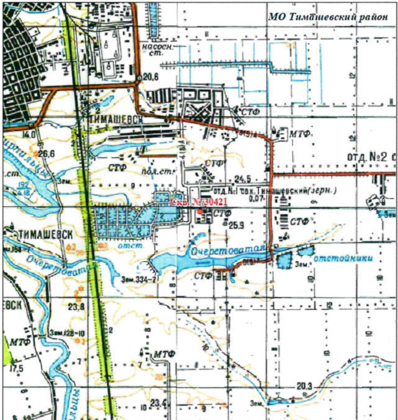
Схема расположения участка недр Масштаб 1:50 000